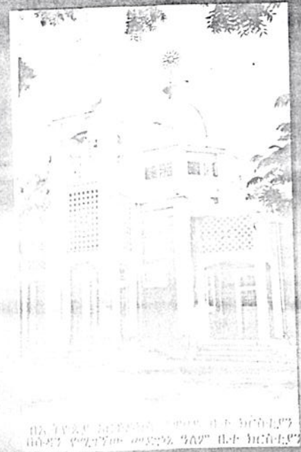
የወንጌል ቤተ ክርስቲያን