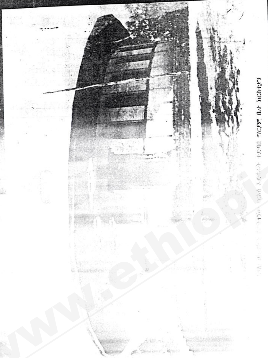
የወንጌል ቤተ ክርስቲያን